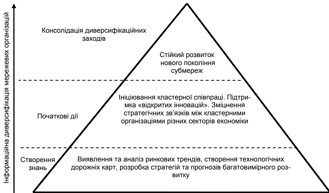
Рис. 2. Процес підтримки кластерної кооперації від дорожньої карти до міжкластерних проєктів

Посередницькі послуги з пошуку партнерів можна вважати ключовою складовою сервісного портфеля кластерних організацій, що діють в ЄС. Регулярні заходи, або семінари, ділові місії, або мережеві візити, є типовими інструментами. Прикладом нестандартної організації посередництва з пошуку партнерів є діяльність Баварського кластера навколишнього середовища, що знаходиться в місті Аугсбурзі. Беручи до уваги, що екологічні технології є наскрізними, тобто актуальними для всіх промислових галузей економіки, управління кластером ввело новий формат для створення міжгалузевої співпраці. Послуги з посередництва у пошуку партнерів передбачають мотивування членів кластера налагоджувати контакти з представниками інших галузей зокрема такими як біотехнологія, виробництво датчиків, мехатроніка й автоматизація, лісове господарства та деревообробна промисловість, харчова промисловість. У результаті створюються передумови для розробки міждисциплінарних та міжгалузевих інноваційних ідей, які можуть мати комерційний потенціал.