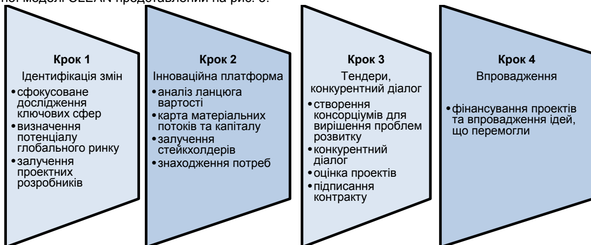
Рис. 3. Кластерні послуги у формуванні інноваційної моделі кластера CLEAN

вданий, оскільки вимагає багато зусиль, щоб структурувати їх у чіткі програми дій, які переслідують конкретну мету. Розвиток проектів може відбуватися через створення інноваційних платформ та діалог з конкурентами. Прикладом розвитку таких послуг є CLEAN – Connecting Danish Cleantech кластер. Він розвивається як модель системних інновацій для вирішення екологічних проблем, що мають складний характер. Модель спрямована на заохочення суб'єктів по всьому ланцюгу вартості до розробки інноваційних екологічних рішень. Мета інноваційної моделі це реалізація конкретних способів вирішення виявлених проблем, які одночасно сприяють інноваціям, відкривають нові можливості для бізнесу та зміцнюють компетенції. Кожен з етапів в інноваційній моделі CLEAN представлений на рис. 3.