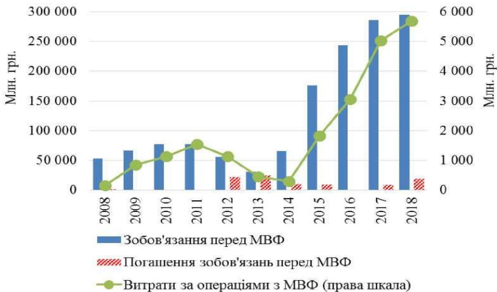
Рис. 3. Зобов'язання перед МВФ, погашення і витрати за ними в 2008-2018 рр.*

Не враховуючи суттєве зменшення представленої частки витрат за існуючими операціями із МВФ у загальній структурі витрат Національного Банку України, різні зобов'язання перед МВФ суттєво зростали за 2015-2017 роки (Рис. 3), тим часом погашення зобов'язань, які виникли перед МВФ було мінімальними.