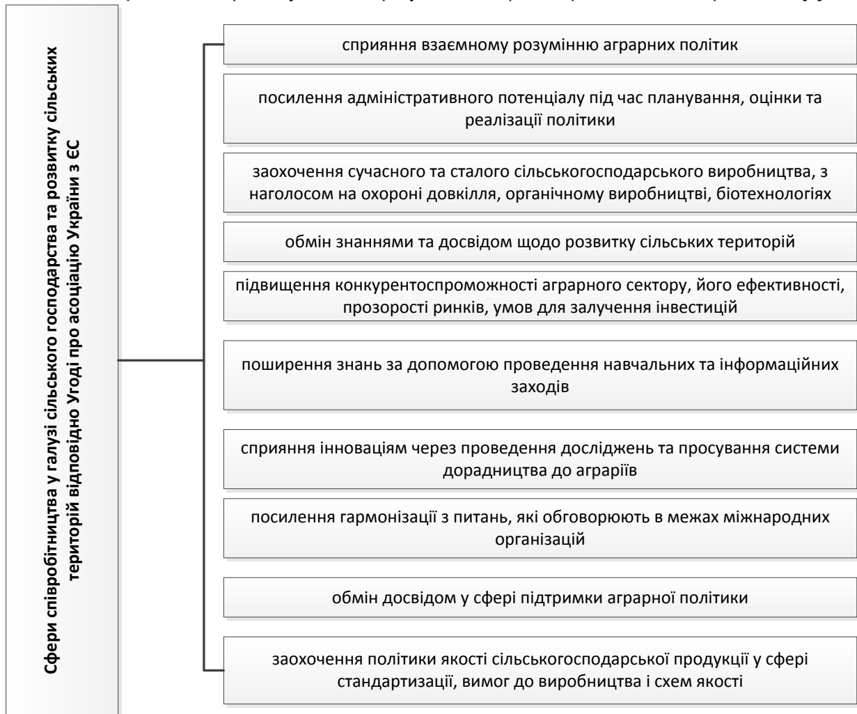
Рис. 2. Сфери співробітництва у галузі сільського господарства у рамках Угоди про асоціацію України з ЄС

Як відомо з квітня 2014 року ЄС в односторонньому порядку скасував мита для українських експортерів, а Україна надає безмитний режим для товарів з ЄС в межах Угоди про зону вільної торгівлі (ЗВТ) з 1 січня 2016 року. Домовленості щодо співпраці України та країн-членів ЄС в аграрному напрямі містяться у Главі 17 «Сільське господарство та розвиток сільських територій» Розділу V «Економічне та галузеве співробітництво» Угоди про Асоціацію і ЗВТ України з ЄС та визначають сфери співробітництва у сільськогосподарській галузі (Рис. 2). Відповідно, Україна має гармонізувати свої регулятивні норми з правом та стандартами ЄС [4].