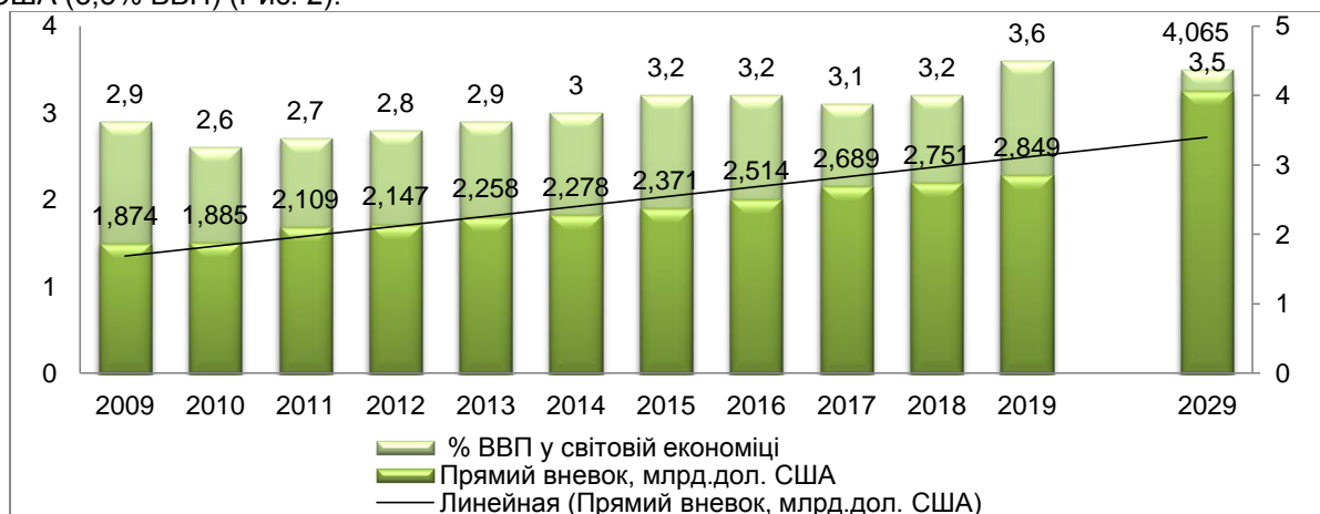
Рис. 2. Прямий внесок мультиплікатора інвестиційних витрат індустрії туристичних послуг у світовому ВВП

Зазначимо, що у 2018 р. прямий внесок мультиплікатора інвестиційних витрат індустрії туристичних послуг у світовому ВВП дорівнював 2750,7 млрд. дол. США (3,2% ВВП), у 2019 р. – 3,6% (або 2849,2 млрд. дол. США), що показує значну активність фінансового обслуговування туристичних потоків галузей (готелів, туристичних агентів, авіакомпанії та інших пасажирських перевезень). Очікується, що даний показник в 2029 р. зросте на 3,6% або до 4065,0 млрд. дол. США (3,5% ВВП) (Рис. 2).