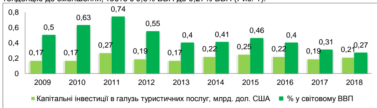
Рис. 1. Капітальні інвестиції в індустрії туристичних послуг України

Капітальні інвестиції в індустрію туристичних послуг України (будівництво та модернізацію засобів розміщення, транспортне обладнання, ресторанне господарство, заклади та організацію дозвілля) за період 2009-2018 рр. збільшилися лише в 1,2 рази, а їх частка навпаки мала тенденцію до зменшення, тобто з 0,5% ВВП до 0,27% ВВП (Рис. 1).