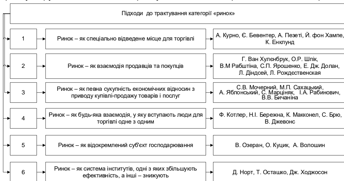
Рис. 2. Сутність поняття «ринок» залежно від його ключових характеристик

Отже, після вивчення та аналізу різних трактувань поняття «ринок» можна стверджувати, що не існує єдиного узагальненого підходу, тому доцільно буде провести групування різних підходів із виділенням ключової риси, яка характерна для ринку. Згруповані підходи до трактування поняття «ринок» наведені на рис. 2.