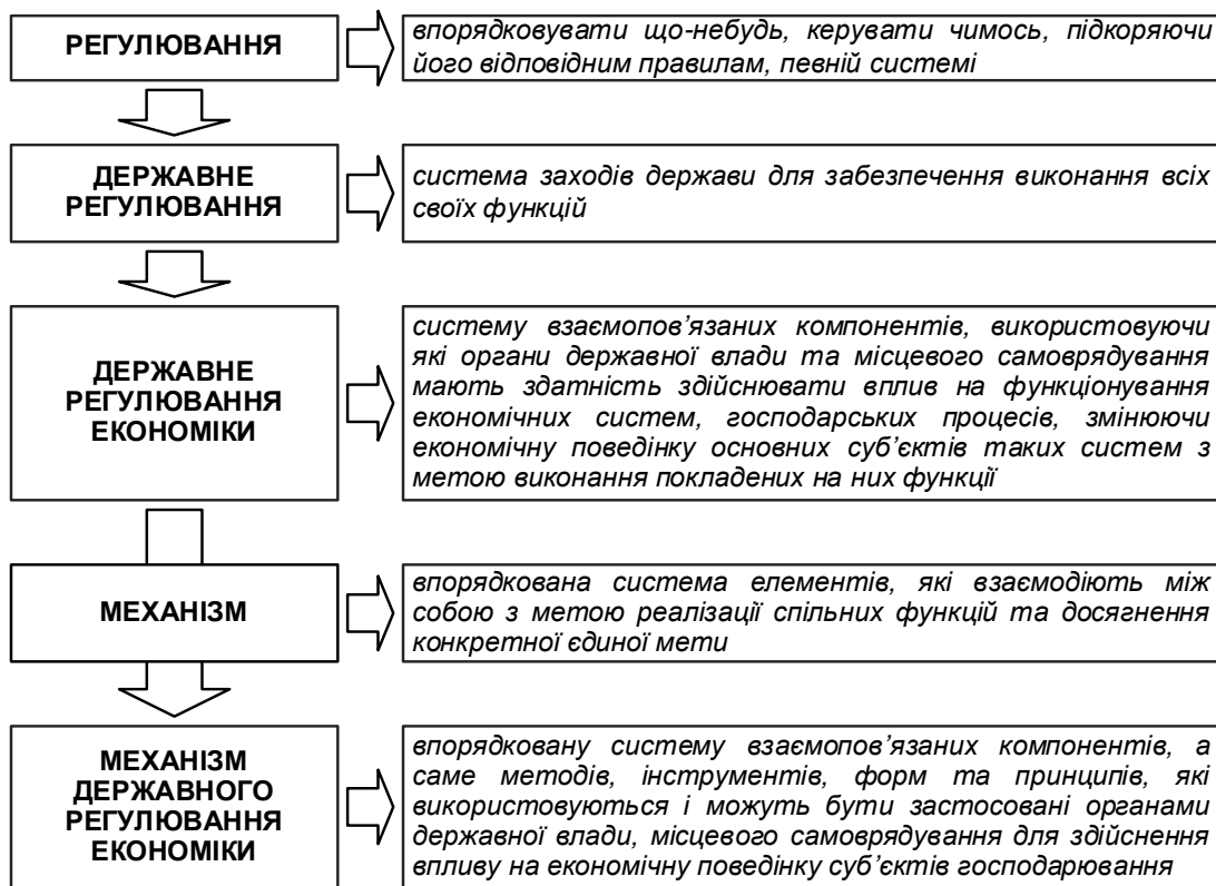
Рис. 1. Сутність категорії

8) залученість до здійснення органами державної влади та місцевого самоврядування покладених на її суспільством функцій та ін.