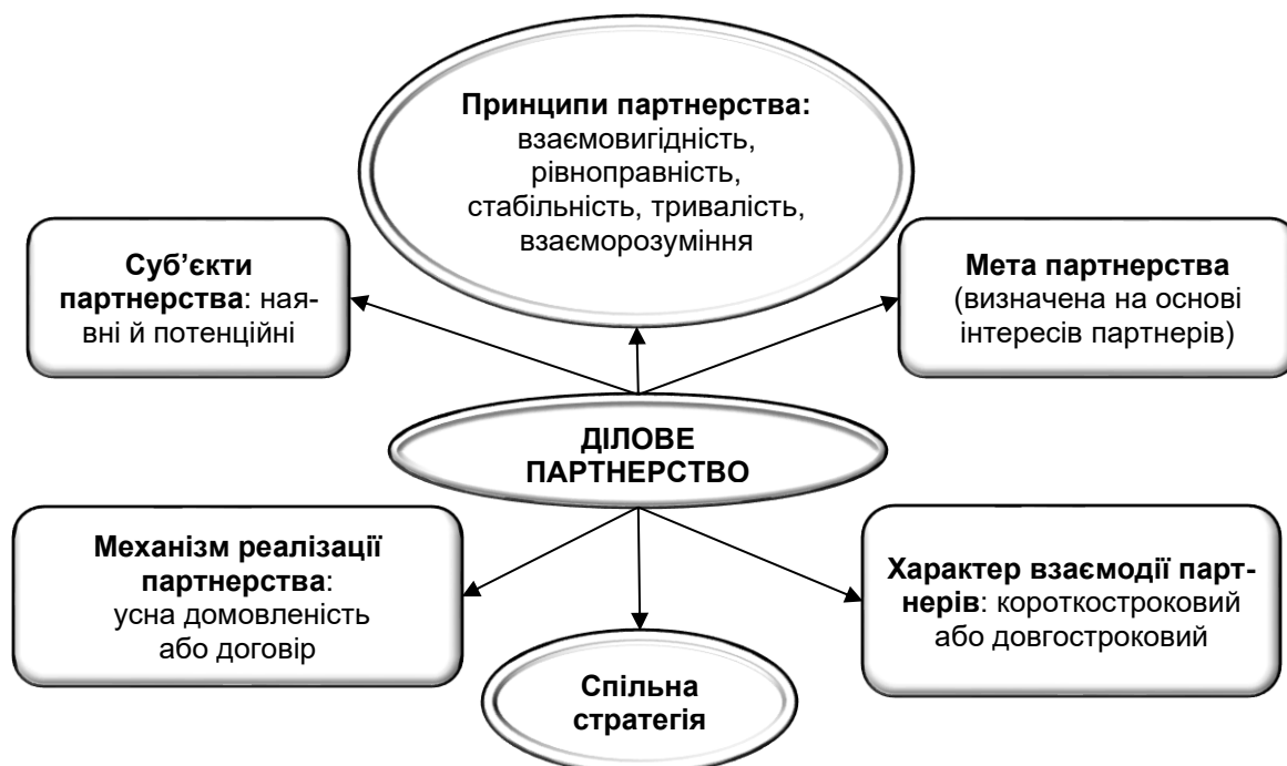
Рис. 1. Загальна характеристика ділового партнерства

На перерахованих вище принципах повинно базуватися і управління діловим партнерством закладів освіти та підприємств, яке, безумовно, має свої особливості й потребує окремого вивчення та аналізу. Поява терміна «дуальна форма здобуття освіти» в українському законодавстві актуалізувало питання дослідження ділового партнерства для пошуку шляхів ефективного впровадження його в реальне життя.