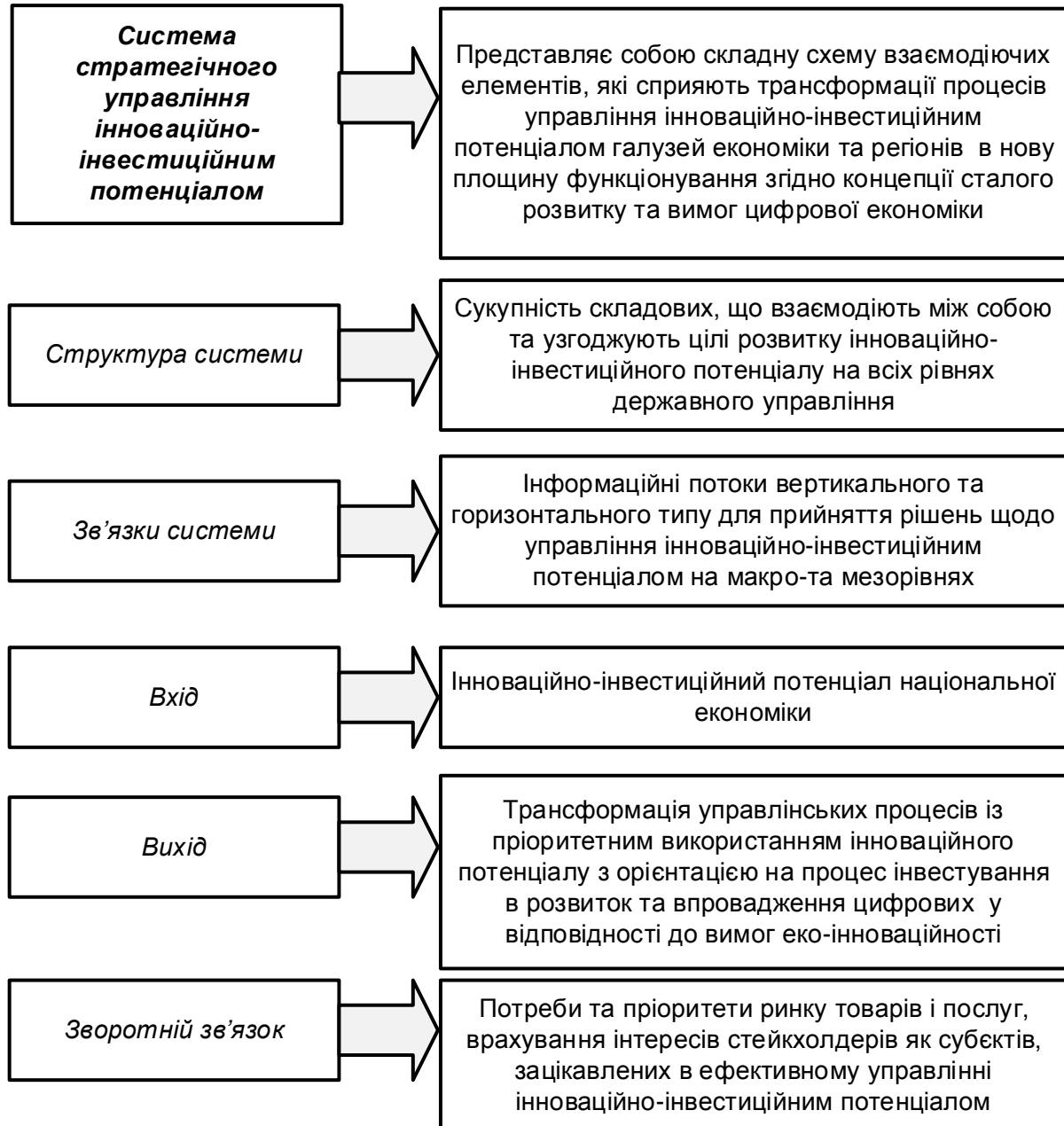
Рис.2. Параметри системи стратегічного управління інноваційно-інвестиційним потенціалом

інвестиційних процесів в нову площину, базисом якої є цифрові технології та інструменти, біоекономіка та стійкий економічний розвиток. На основі зазначеного вище вважаємо доцільним концептуалізувати параметри системи стратегічного управління (рис. 2).