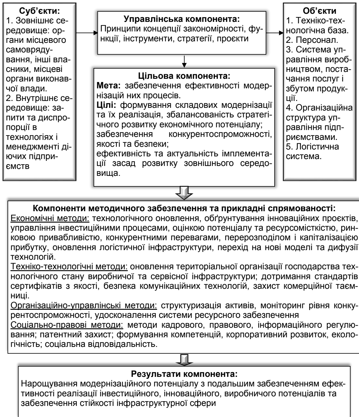
Рис. 2. Організаційно-економічний механізм модернізації підприємств інженерної інфраструктури