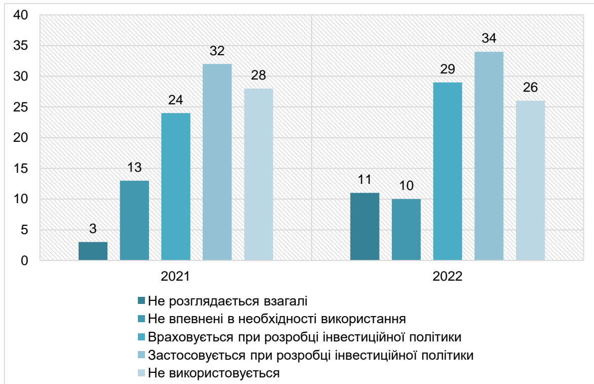
Рисунок 2. Впровадження ESG напрямків в інвестиційну політику компаній (Європа, Північна Америка, Азіатсько-Тихоокеанський регіон)

використання ESG-підходу як основного при розробці інвестиційної політики (31 % для європейських країн проти 18 % у Північній Америці та 22 % у Азіатсько-Тихоокеанському регіоні), що також свідчить про наявність відповідної системи нормативно-правового регулювання [10].