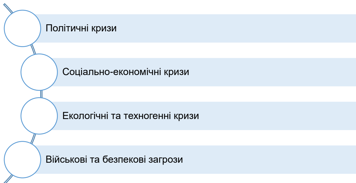
Рисунок 1. Основні типи криз на регіональному рівні в контексті забезпечення національної безпеки

Кризові ситуації на регіональному рівні мають безпосередній вплив на національну безпеку держави, оскільки вони можуть призводити до дестабілізації внутрішньої ситуації, послаблення економічної та соціальної стійкості, а також створювати передумови для зовнішнього втручання. У загальному аспекті до основних типів криз на регіональному рівні належать (рис. 1):