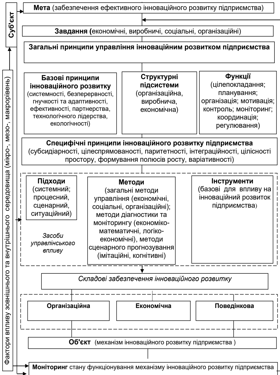
Рисунок 2. Концептуальна схема механізму інноваційного розвитку підприємства