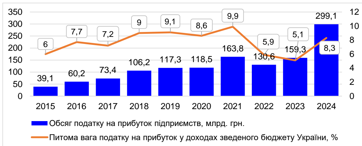
Рисунок 2. Динаміка надходжень податку на прибуток підприємств до зведеного бюджету України у 2015 – 2024 роках

наближенням показника його частки у формуванні доходів бюджету до передвоєнного рівня. Щоправда, це пояснюється не тільки адаптацією вітчизняного бізнесу до роботи в нових для нього складних умовах, а й іншими відчутними змінами в податковому законодавстві [5].