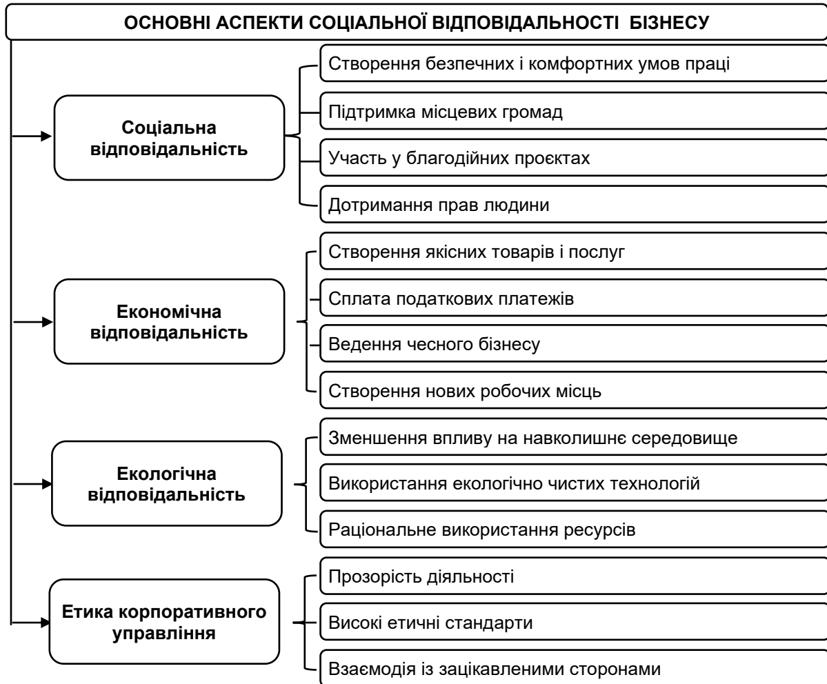
Рисунок 1. Ключові аспекти соціальної відповідальності бізнесу

Соціальна відповідальність бізнесу як конкретне соціально-економічне явище має такі основні аспекти (рисунок 1).