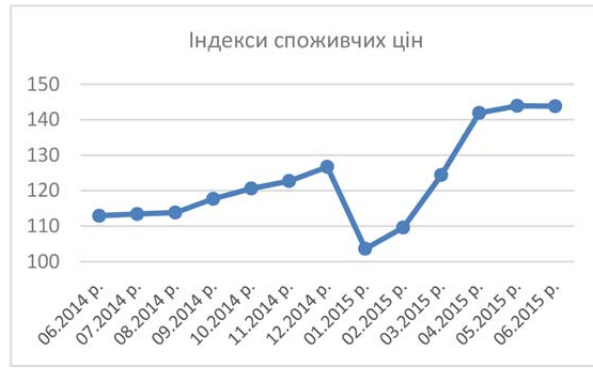
Рис. 2. Індекси споживчих цін у 2014-2015 рр., у % до грудня відповідного попереднього року

Джерело: побудовано авторами за даними [5, 6]