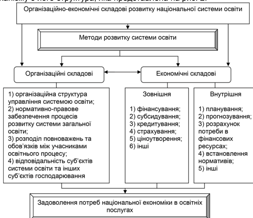
Рис. 2. Базові складові організаційно-економічного механізму розвитку національної системи освіти

Механізм управління розвитком системи освіти повинен здійснюватись одночасно як на рівні національної економіки, так і певного регіону, місцевості та навчального закладу. Виходячи з цього, організаційно-економічний механізм, запропонований нами, враховує особливості його функціонування на всіх вищезазначених рівнях. Ключовим елементом організаційно-економічного механізму є його структура, яка представлена на рис. 2.